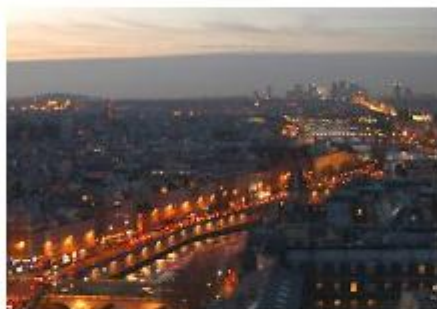
Parigi, la Ville lumière