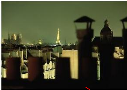
10 luoghi culturali da non perdere a Parigi