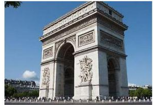
L'Arco di Trionfo di Parigi